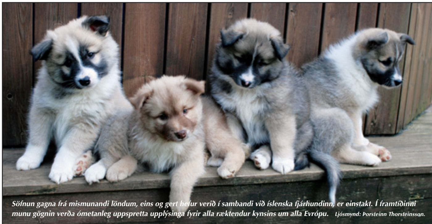
Söfnun gagna frá mismunandi löndum, eins og gert hefur verið í sambandi við íslenska fjárhundinn, er einstakt. Í framtíðinni munu gögnin verða ómetanleg uppspretta upplýsinga fyrir alla ræktendur kynsins um alla Evrópu.

Tíðni mjaðmalos í sænska stofninum hefur breyst lítið og verið um 20%, að hámarki 28% árið 2001. Á síðustu árum hefur tíðnin lækkað í um 20%. Þetta há tíðni gerir nauðsynlegt að fylgjast samfelld með niðurstöðunum, vera varkár og rækta ekki frá hundum með mjaðmalos. Engin þörf er á flókinni ræktunaráætlun. Í hópi þýskra fjárhunda sem Swedish Dog Training Centre átti, tókst okkur að lækka tíðni mjaðmalos úr rúmlega 50% niður fyrir 10% á innan við tíu árum með því að taka upp nokkrar mjög einfaldar ræktunareglur. Ekki var leyft að rækta frá hundum með mjaðmalos. Ræktunardýr urðu að vera afkvæmi hunda sem ekki voru með mjaðmalos og að hámarki mátti eitt gotsystkina þeirra vera með mjaðmalos og þá einungis í mildu formi. Þetta voru einu reglurnar sem notaðar voru við val gegn mjaðmalosi og áhrifin sáust fljótt á lækkaðri tíðni mjaðmalos í hópnum. Engin þörf er á flóknum ræktunaráætlunum (index)