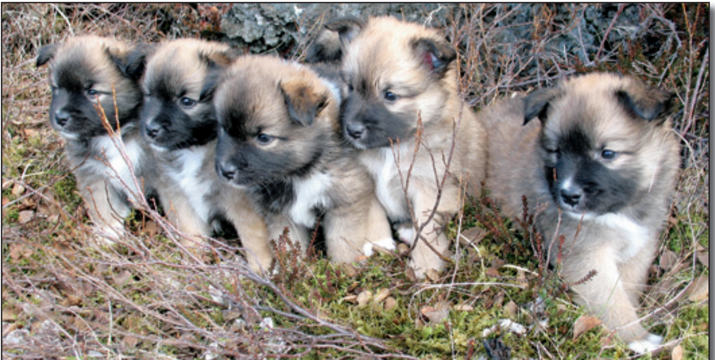
Þörf er á alþjóðlegu samkomulagi, samvinnu og skiptum á ræktunardýrum milli landanna til að stöðva mikið tap á erfðabreytileika.

Allir útreikningar á ræktunargrunni í þessari skýrslu hafa verið gerðir í forriti mínu „LatHunden 2006“. Tvö gildi eru reiknuð út, hagnýtur ræktunargrunnur (e. utilized effective population size) og tiltækur ræktunargrunnur (e.