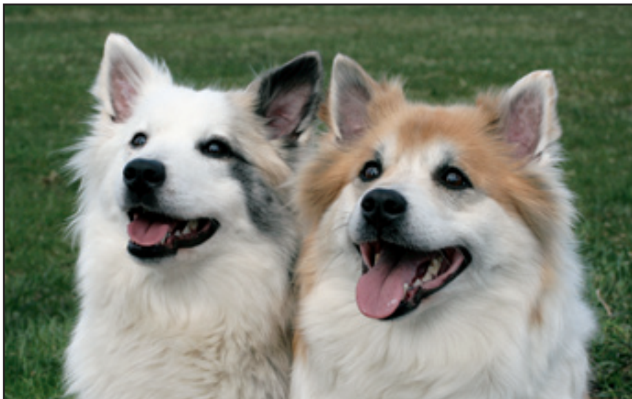
Almenn regla ætti að vera að forðast að rækta frá dýrum sem hafa ekki náð tveggja ára aldri í hvaða kyni sem er, sérstaklega ef í kyninu finnast erfðasjúkdómar sem koma ekki fram fyrr en hundarnir eru orðnir fullþroskaðir.

eins og notaðir eru í sumum kynjum í Þýskalandi. Ræktunarútreikningar hafa mest gildi þegar valið er gagnvart eiginleikum með lágt arfgengi. Almenn arfgengi mjaðmaloss er 40–50% og í tilvikum sem þessum er einfalt val algjörlega nægjanlegt til að ná skjótum árangri. Slík kerfi hafa sömuleiðis mikla kosti því að allir ræktendur munu skilja nákvæmlega hvað hann eða hún er að gera og geta þannig forðast vandamál við að þurfa að bera saman þekkingu á sínum eigin hundum og tölfraðilegar upplýsingar sem margir skilja ekki algjörlega hvernig eru reiknaðar út.